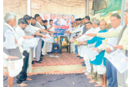
हरिभूमि न्यूज ▶▶ ब्यावरा

मलावर नगर में ब्लॉक कांग्रेस कमेटी गादिया द्वारा मलावर एव आगर मंडल की संयुक्त बैठक का